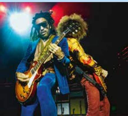
Lenny Kravitz.