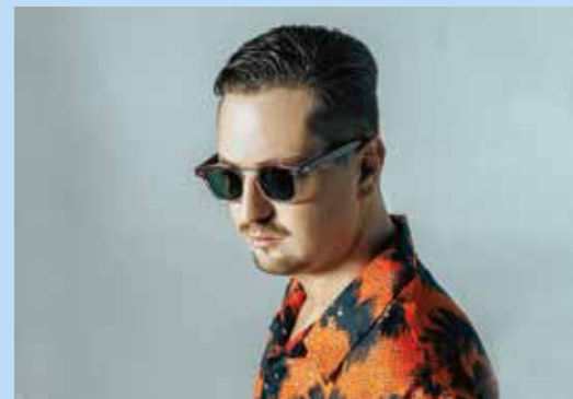
Robin Schulz.